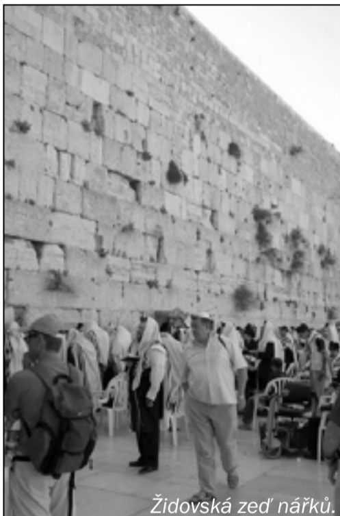
Židovská zeď nářků.

A teď si přečteme, co k metodě rozdělení Palestiny napsalo rudé Právo v sobotu 10. května 2008 z pera M. Šišky: „Rezoluce o rozdělení musela být přijata dvoutřetinovou většinou Valného shromáždění OSN (26.11.1947). Šéfové židovské agentury si snadno spočítali, že tolik hlasů nedostanou. V této situaci se rozhodli pro poslední manévry: shromáždili všechny delegáty nakloněné jejich věci a požádali je, aby do večera obsadili řečnickou tribunu. Nečekáný maratón projevů donutil předsedu schůze odložit hlasování na příští zasedání 29. listopadu. V získaném čase – hlavně po velkém nátlaku Spojených států – změnilo několik delegací své původní odmítavé stanovisko a hlasovalo pro rezoluci.“ A tak vlastně vznikl v Palestině stát Izrael! Legrace k popukání, že...? Vzpomeňme na mediál-