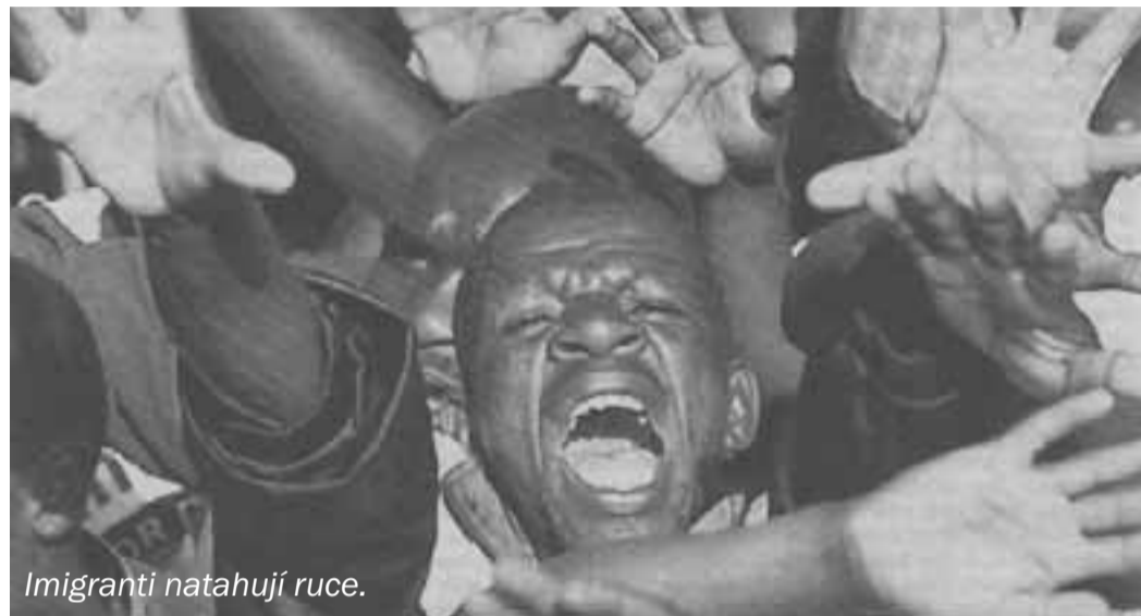
Imigranti natahují ruce.

Pro lidi zvané do Francie v rámci slučování rodin a žijící v zemích, kde nelze příliš spoléhat na úřední záznamy, zákon zavádí testy DNA. Má tak být prokázána jejich příbuznost s osobou, která je chce přivzít. Vzhledem k tomu, že návrh tohoto článku vyvolal mezi opozicí pozdvižení a výhrady měli i členové vládního tábora, budou testy zavedeny pokusně do roku 2010. Je přitom nutný výslovný souhlas testovaného. Bude-li výsledek testu pozitivní, hradí náklady francouzský stát. Seznam zemí, jichž se má opatření týkat, bude stanoven dekretem. Francouzi přijatým opatřením dávají najevo obavy z dalšího přílivu nevídaných imigrantů.