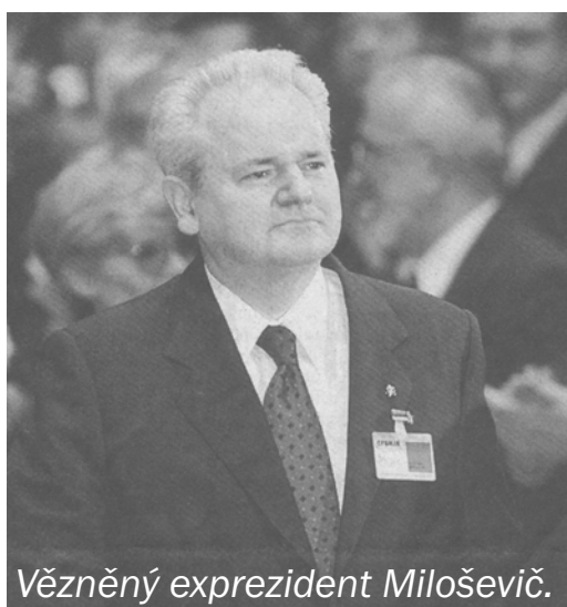
Vězněný exprezident Milošević.

Pučem dosazený prozápadní režim tak ustoupil výhrůžkám o pozastavení finanční pomoci, kterou válkou zničená země nutně potřebovala. Začátkem dubna 2001 byl Milošević pod smyšlenou záminkou chystaného převratu zatčen a do svého vydání držen za mřížemi. A to i přes nesouhlasné reakce