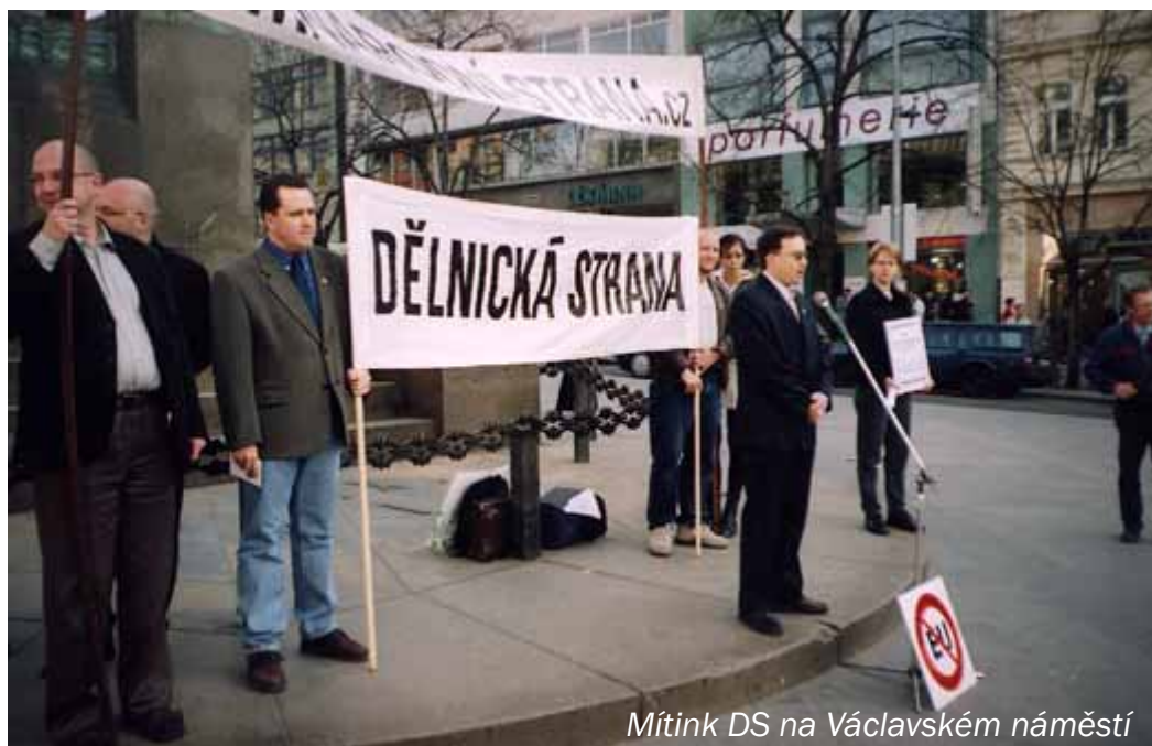
Mítink DS na Václavském náměstí

„Bez nadsázky je možno říci, že případný vstup do unie se dotkne každého občana a každé lidské čin-